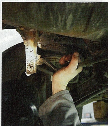
Ruimte op de rubbers van de stabilisatorstang. Klusje voor de doe-het-zelver.