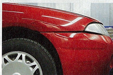
Kreukelige herinnering aan een Franse vakantie.

van een auto met hagelschade die nooit op kenteken is gezet. De achtervering zelfs is aan de slappe kant. Bij verkeersdrempels heb je daardoor al snel contact met het wegdek. Dat komt waarschijnlijk ook door de gastank en de trekhaak, die maken 'm aardig wat zwaarder. De uitlaat heb ik zelf gelast, met een goedkoop lasapparaatje uit de supermarkt. In 2007 is er ingebroken. De dader sloeg een ruitje stuk. Vreemd genoeg is er niets meegenomen, dus misschien was het ook domweg vandalisme. Het ruitje heb ik van de sloop, aangezien het eigen risico bij de verzekering al € 75 bedroeg."