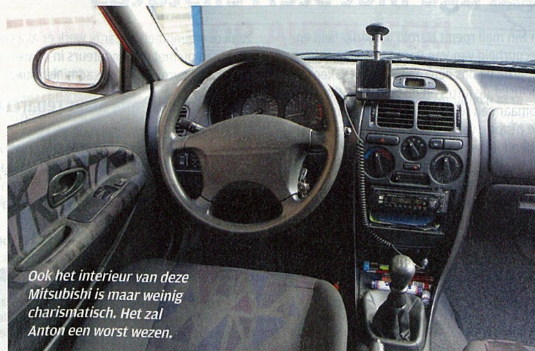
Ook het interieur van deze Mitsubishi is maar weinig charismatisch. Het zal Anton een worst wezen.